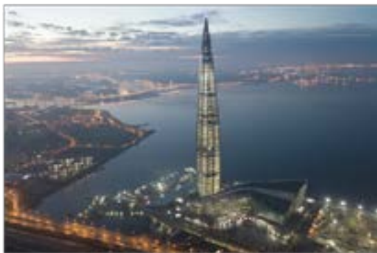
Лахта-центр в Санкт-Петербурге (462 м).