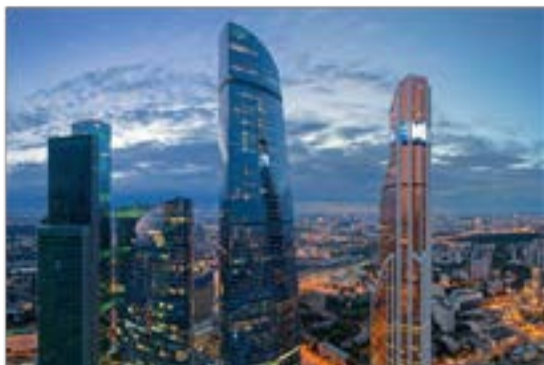
ФК «Федерация» (башня «Восток») в Москве (373,7 м).