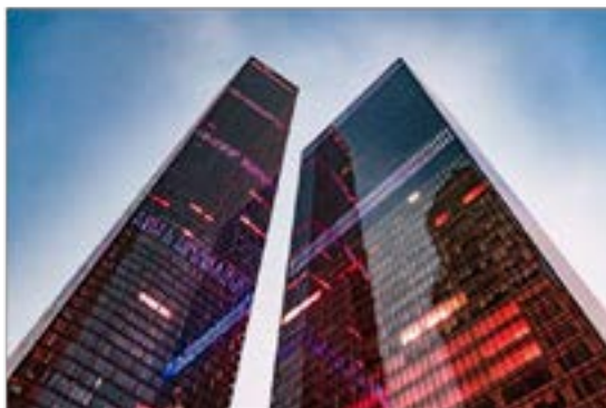
МФК «Око» (Южная башня) в Москве (354,1 м).